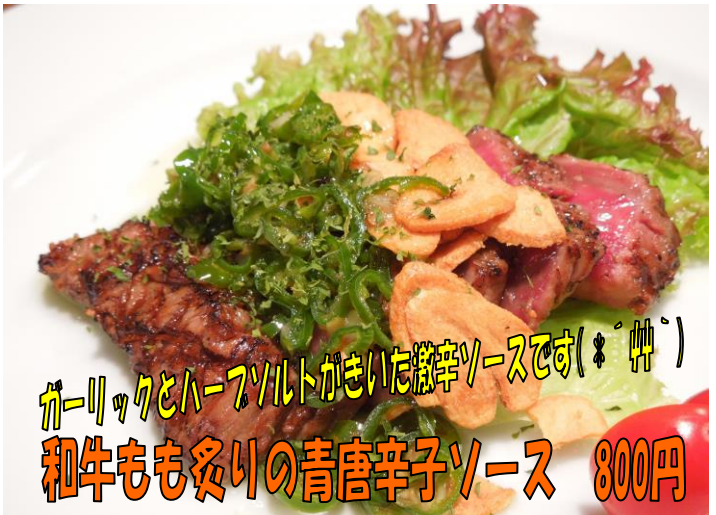
ガーリックとハーブソルトがきいた激辛ソースです(*´艸`) 和牛もも炙りの青唐辛子ソース 800円