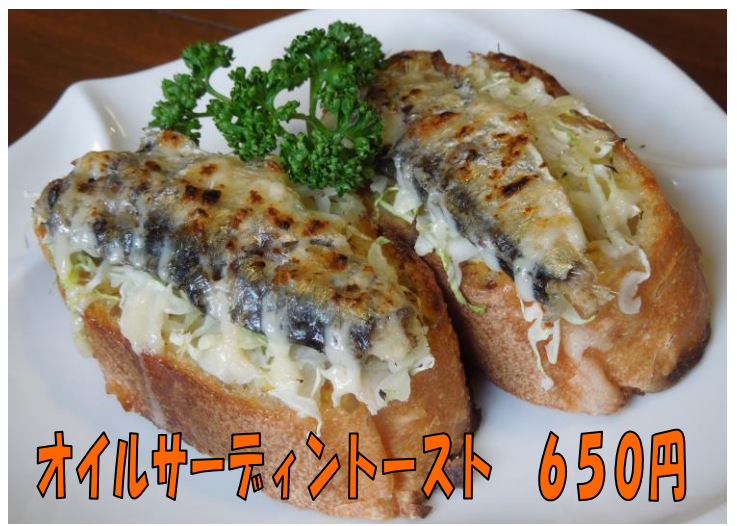
オイルサーティン toast 650円