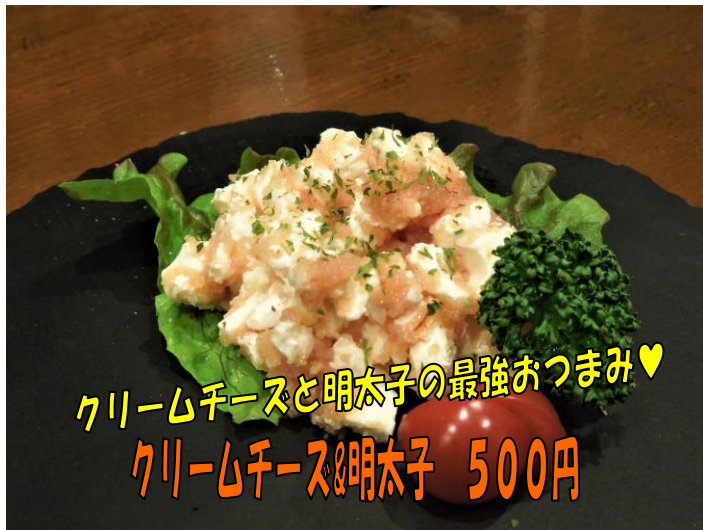
クリームチーズと明太子の最強おつまみ♡ クリームチーズ&明太子 500円