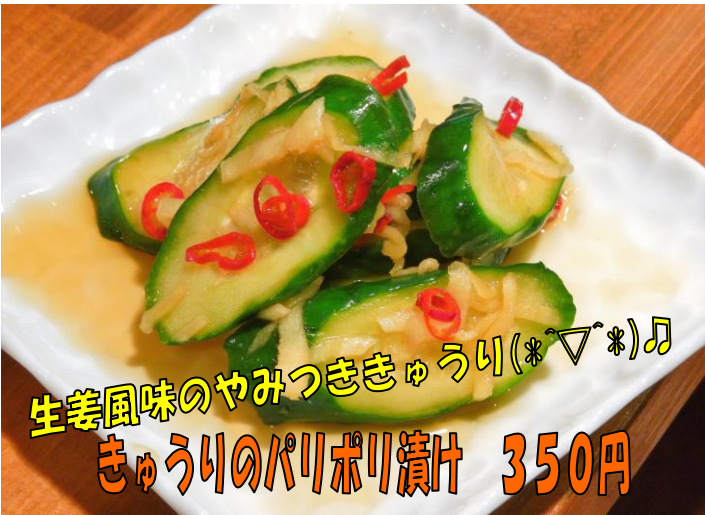
生姜風味のやみつききゅうり(*´▽`*)♪ きゅうりのパリパリ漬汁 350円