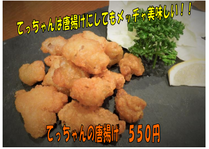
てっちゃんはお揚げにしてもメッチャ美味しい！！ てっちゃんのお揚げ 550円