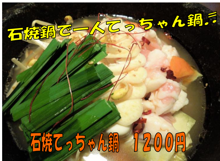
石焼鍋でーんとてっちゃん鍋♪ 石焼てっちゃん鍋 1200円