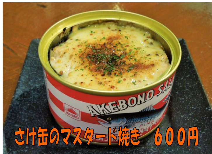
さけ缶のマスタード焼き 600円