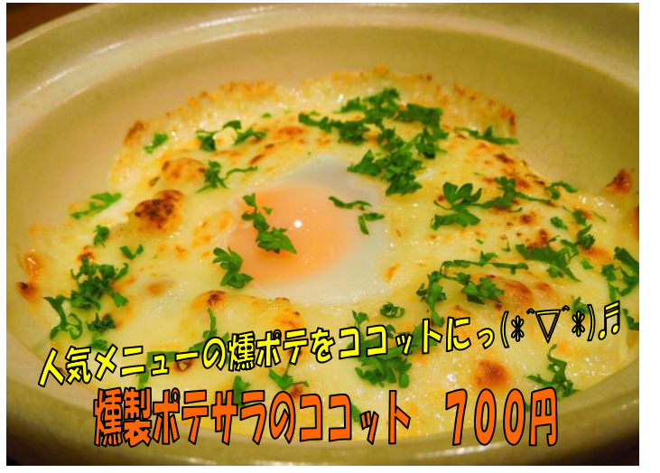
人気メニューの燻ポテをココットにっ(*▽*)♪ 燻製ポテサラのココット 700円