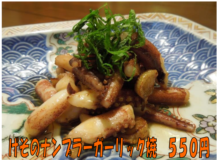
げそのナンフライガーリック焼 550円