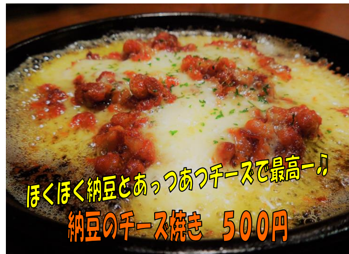
ほくほく納豆とあっつあっつチーズで最高ー♪ 納豆のチーズ焼き 500円