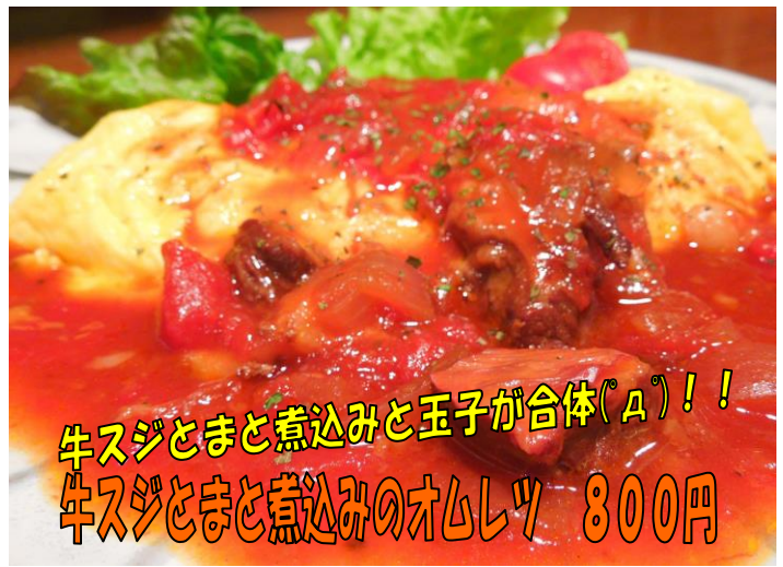
牛スジとまと煮込みと玉子が合体(㊦)!! 牛スジとまと煮込みのオムレツ 800円