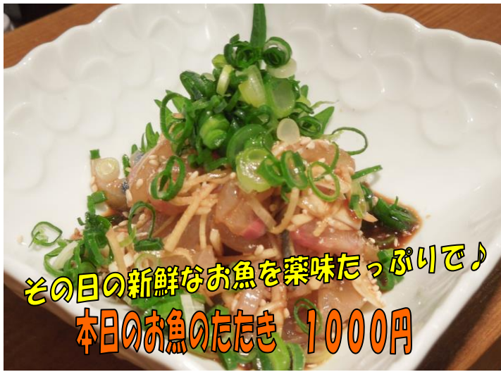
その日の新鮮なお魚を薬味たっぷり♪ 本日のお魚のたたき 1000円