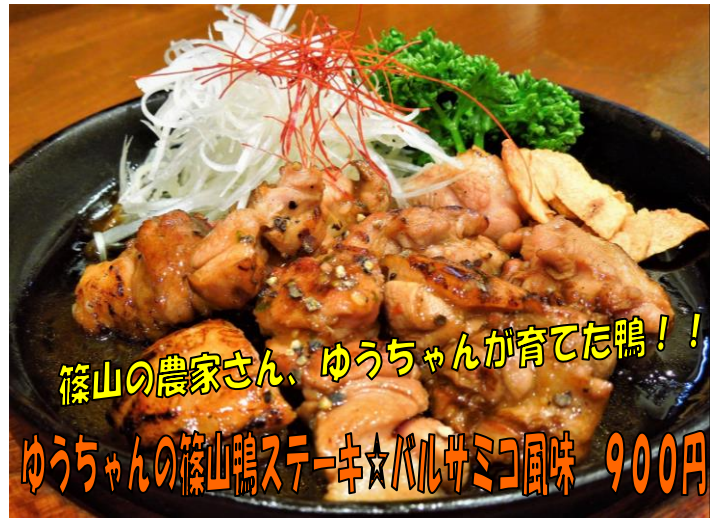
篠山の農家さん、ゆうちゃんが育てた鴨！！ ゆうちゃんの篠山鴨ステーキ☆バルサミコ風味 900円