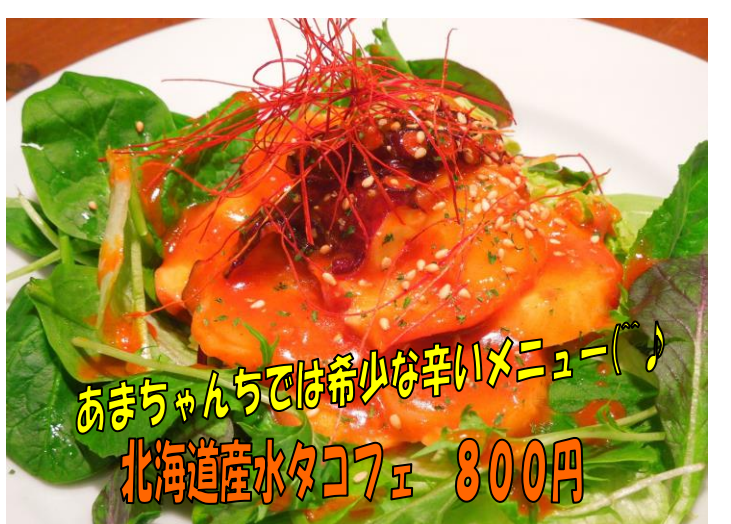
あまちゃんちでは希少な辛いメニュー(´▽`)♪ 北海道産水タコフェ 800円