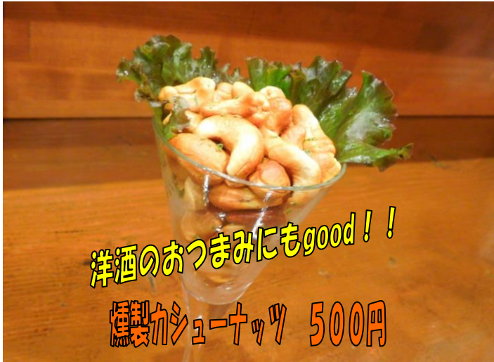
洋酒のおつまみにもgood！！ 燻製カシューナッツ 500円