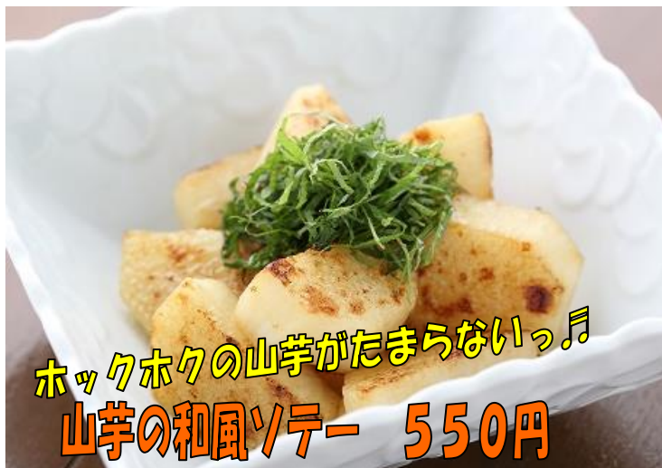
ホックホクの山芋がたまらないっ♪ 山芋の和風ソテー 550円