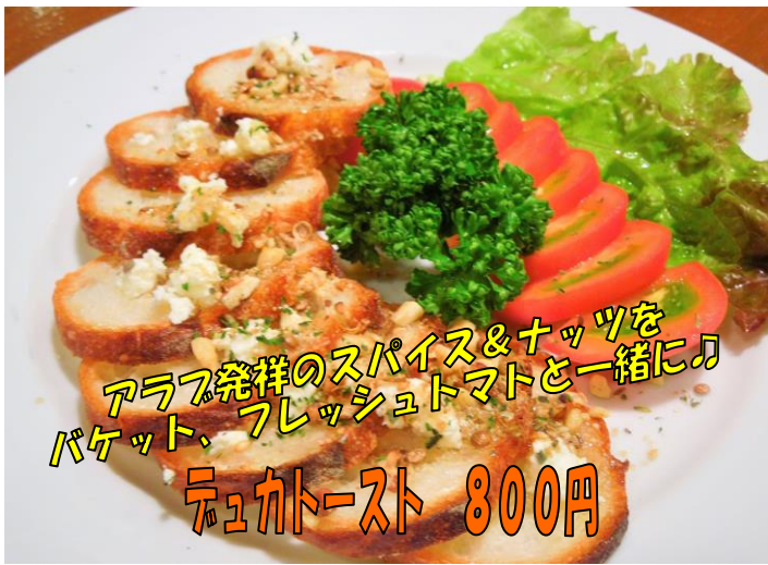
アラブ発祥のスパイス&ナッツを バケット、フレッシュトマトと一緒に♪ テュカトースト 800円