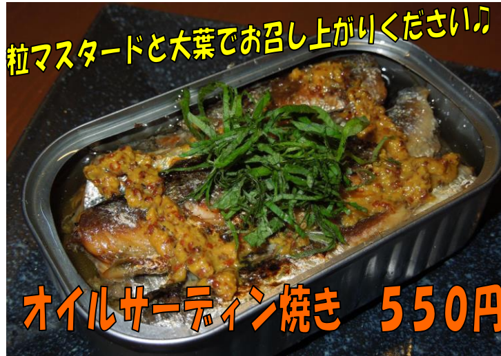
粒マスタードと大葉でお召し上がりください♪ オイルサーティン焼き 550円