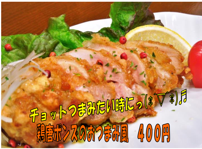
チョットつまみたい時にっ(*▽*)♪ 鶏唐ボンスのおつまみ風 400円