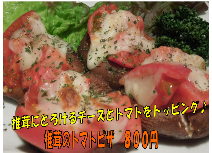
椎茸にとろけるチーズとトマトをトッピング♪ 椎茸のトマトピザ 800円