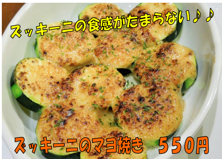
スッキーニの食感がたまらない♪♪ スッキーニのマヨ焼き 550円