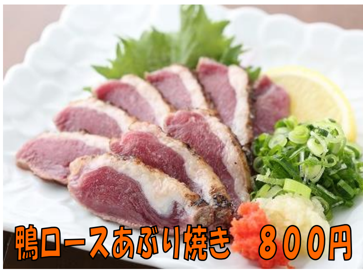
鴨ロースあぶり焼き 800円