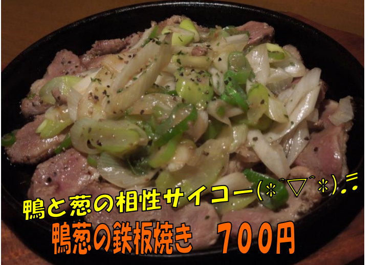
鴨と葱の相性サイコー(*▽*)!! 鴨葱の鉄板焼き 700円