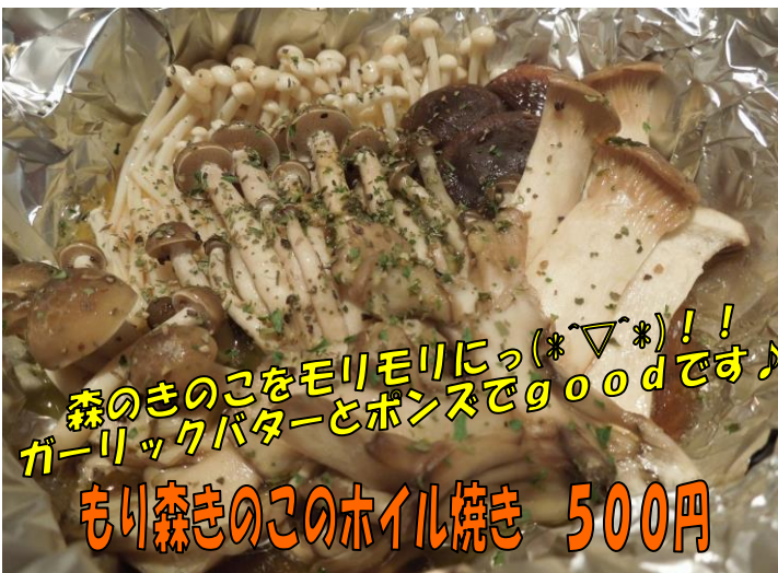
森のきのこをモリモリにっ(*▽*)!! ガーリックバターとポンズでgoodです♪ もり森きのこのホイル焼き 500円