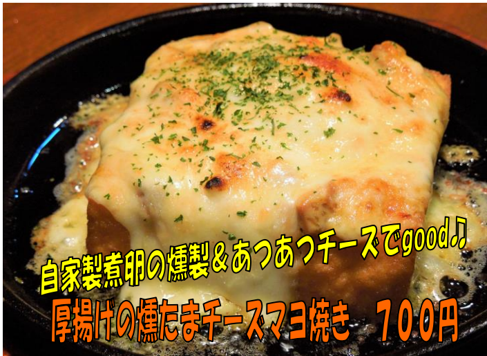
自家製煮卵の燻製&あつあつチーズでgood♪ 厚揚げの燻たまチーズマヨ焼き 700円