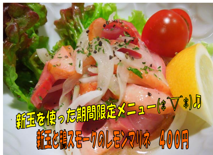
新玉を使った期間限定メニュー(*▽*)♪ 新玉と鴨スモークのレモンマリネ 400円