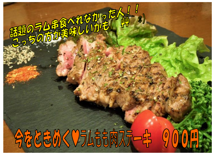
話題のラム串食べれなかった人!! こっちの方が美味しいかも(*´艸`*) 今をときめく♥ラムもも肉ステーキ 900円