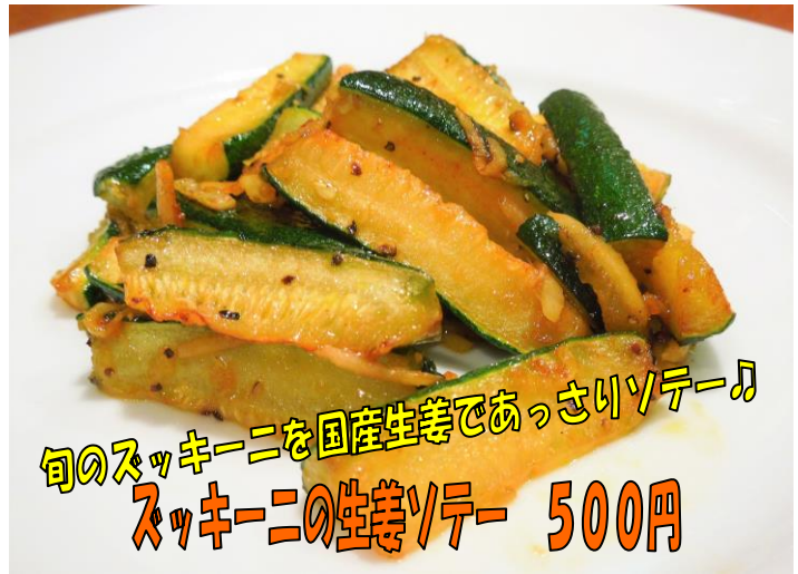
旬のスキニーニを国産生姜であっさりソテー♪ スキニーニの生姜ソテー 500円