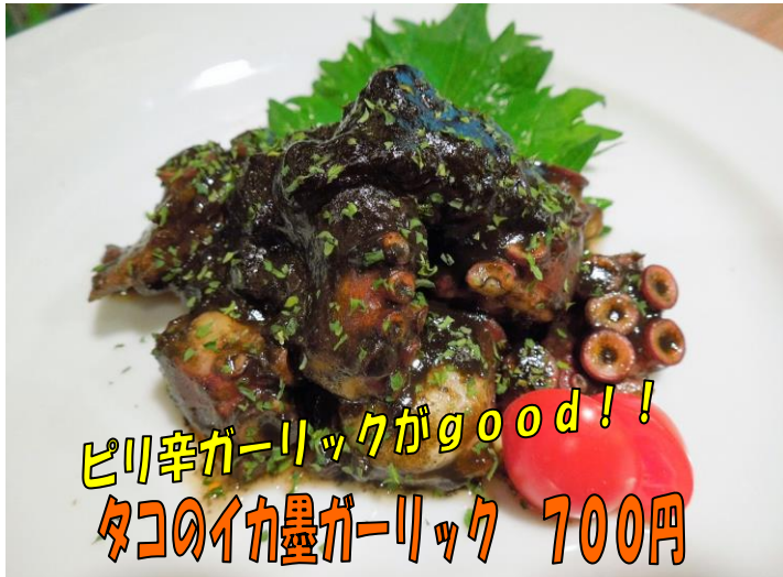
ピリ辛ガーリックがgood!! タコのイカ墨ガーリック 700円