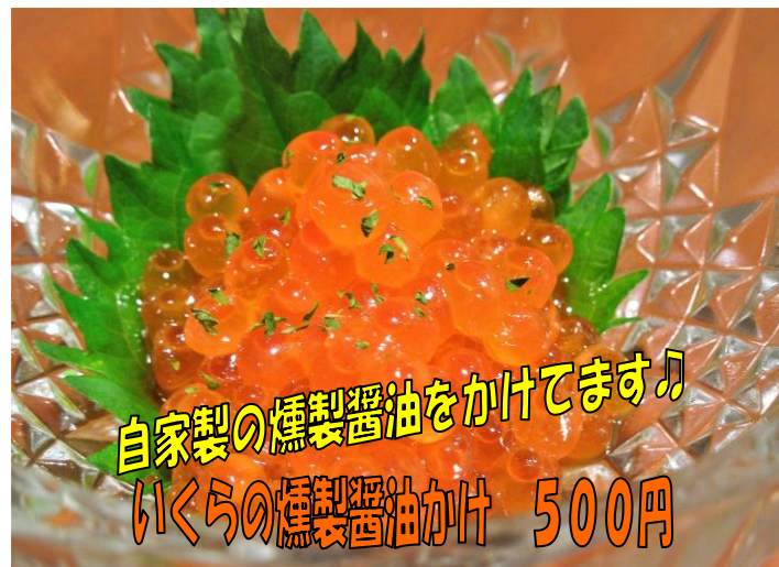
自家製の燻製醤油をかけてます♪ いくら燻製醤油かけ 500円