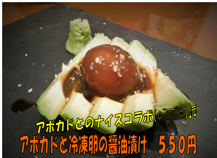
アボカドとのナイスコラボ(*▽*)♪ アボカドと冷凍卵の醤油漬け 550円