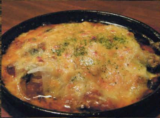
なすピザ風 なすピザ風 700円