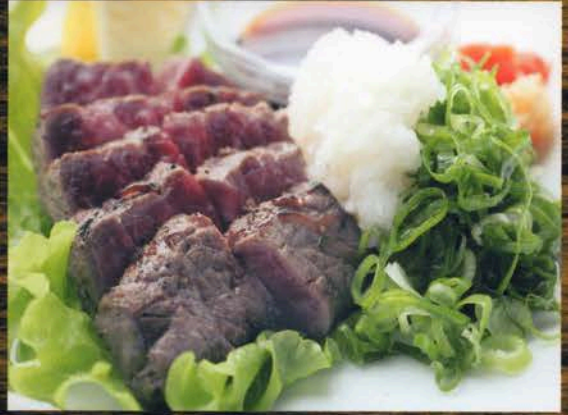
和牛もも炙り焼き 和牛もも炙り焼き 700円