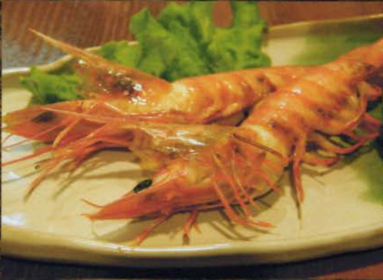
天使の海老塩焼き 天使の海老塩焼き(一匹) 200円