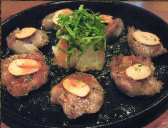
ゲタバラスイコロステーキ ゲタバラスイコロステーキ 700円