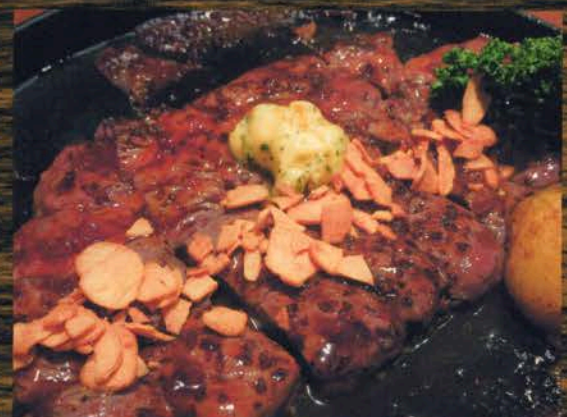
牛肩ロースステーキ 牛肩ロースステーキ 2000円