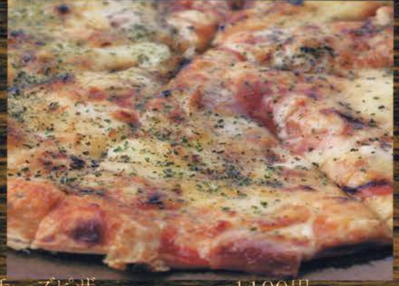
チーズピザ 1100円 トッピング(ツナ・えび・ポテト・とまと・ガーリック・ Wチーズ)各300円