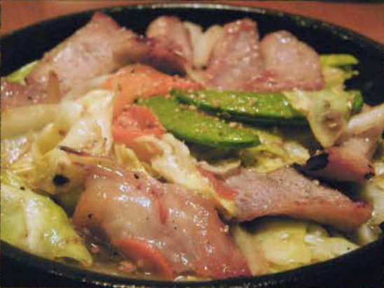
トントロ塩焼き トントロ塩焼き 700円