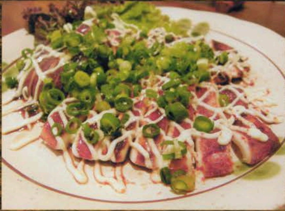
いか姿焼きマヨ いか姿焼きマヨ 600円