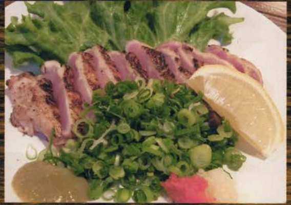
みやざき地頭鶏もも炙り焼き みやざき地頭鶏もも炙り焼き 600円